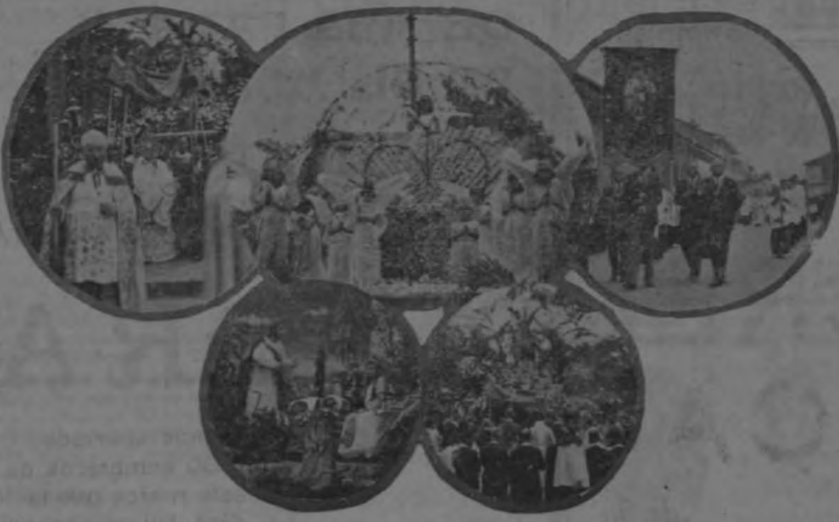
Unas impresiones de los altares y procesiones que ayer en la mañana, solemnizando la fiesta cristiana del Corpus Christi, se verificaron en esta capital y en la vecina Parroquia de San Pedro de Montes de Oca