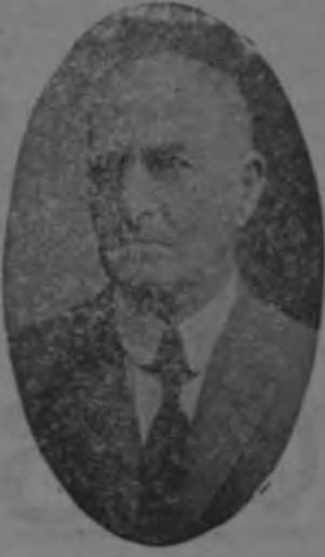
Gral. don Juan Bautista Quirós S.

Con pena anotamos en días pasados del accidente que sufrió el señor Ex-Presidente de la República General don Juan Bautista Quirós, el cual no fue en la ciudad de Alajuela, sino en su casa de habitación en esta capital. Al informarnos en la mañana de hoy del estado de salud del estimable paciente, recibimos con pena la noticia de que el ilustre paciente General Quirós, ha sufrido serios quebrantos en su organismo y que su estado es de bastante gravedad. La noticia que con tanta pena afecta el hogar del distinguido hombre público, motivó intenso dolor en nuestros círculos sociales y políticos. Nos apena el consignar la gravedad del General Quirós, amigo de nuestra alta consideración y deseamos un efectivo y pronto restablecimiento. Al circular nuestro diario en la tarde de hoy, las personas que quieren enterarse del estado de salud del distinguido paciente, podrán hacerlo al teléfono 2787.