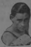
ALVARADO LIBRAS 123

Esta noche, se llevará a cabo en el ring de la Academia Olimpia, el brillante programa boxístico, a cargo exclusivamente de pugilistas nacionales y a precios popularísimos.